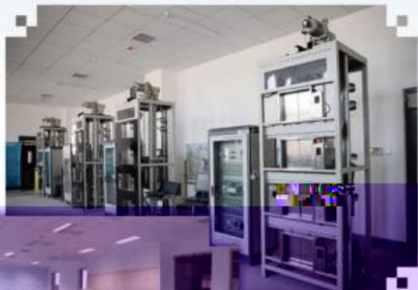
智能电梯安装调试维护训练场所