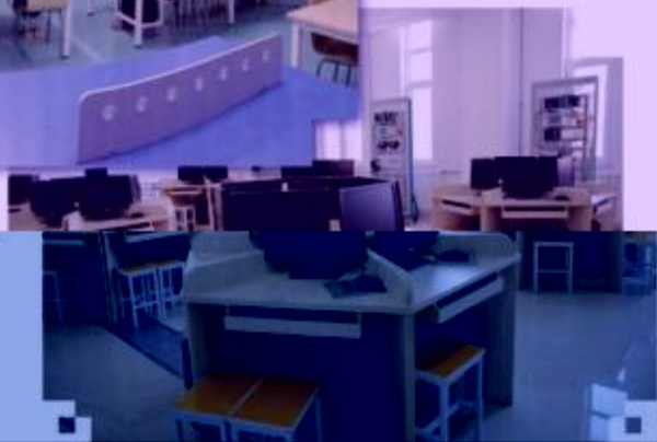
一体化课程教学设计综合实训室