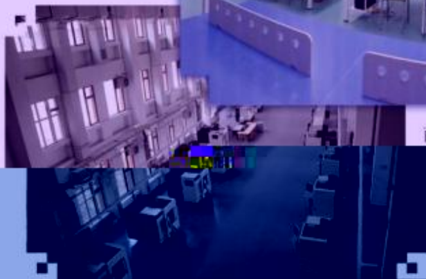
DMG 数控技术训练场所